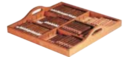
Präsentationsgleitregal aus feuchtigkeitsresistentem Holz. Uitschuifbaar presentatieplateau (in exotisch hout bestand tegen houtrot)