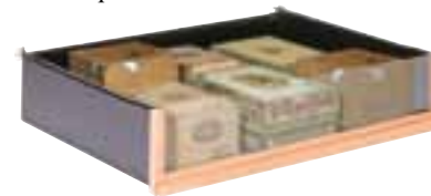
Holzregal Uitschuiflade voor opslag

Konzeptionsbedingt ist der Zigarrenklimaschrank evolutiv und wächst folglich mit. Es werden verschiedene, praktische Regale angeboten, die Ihre Ansprüche noch besser erfüllen.