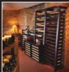
Regalsysteme und Weinkeller-Klimageräte Opbergsystemen en klimaatregelaars