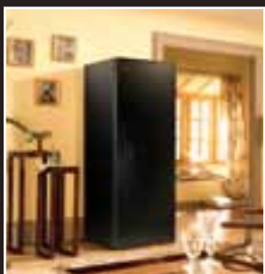
Weinklimaschränke – Serie Première Wijnkasten - Première-lijn